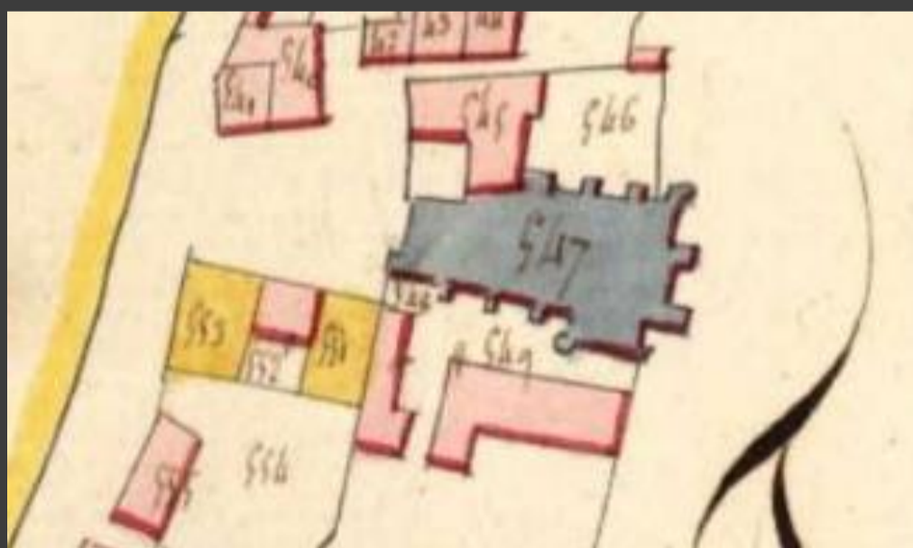
Cadastré napoléonien (1811) · © ADML

Le 12 avril 1791, la maison prieurale et ses dépendances sont vendues à un certain Le Roy fils, maître menuisier (il s'agit très probablement du maire de l'époque : Luc Leroy).