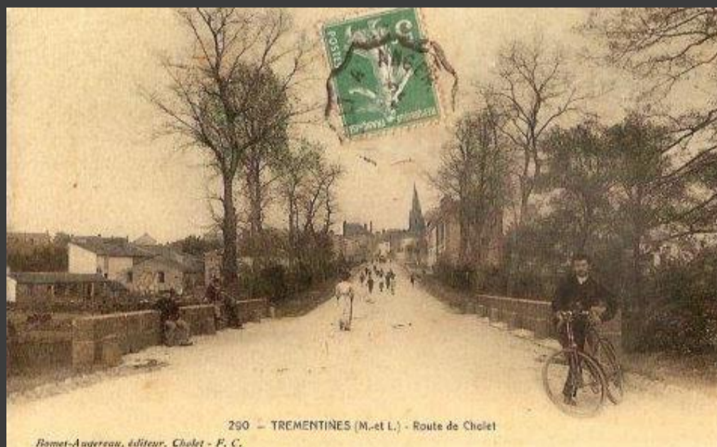
Carte postale · Route de Cholet

L'appellation « du Vieux Pont » fut naturellement donné à la rue qui emprunte l'édifice encore aujourd'hui.