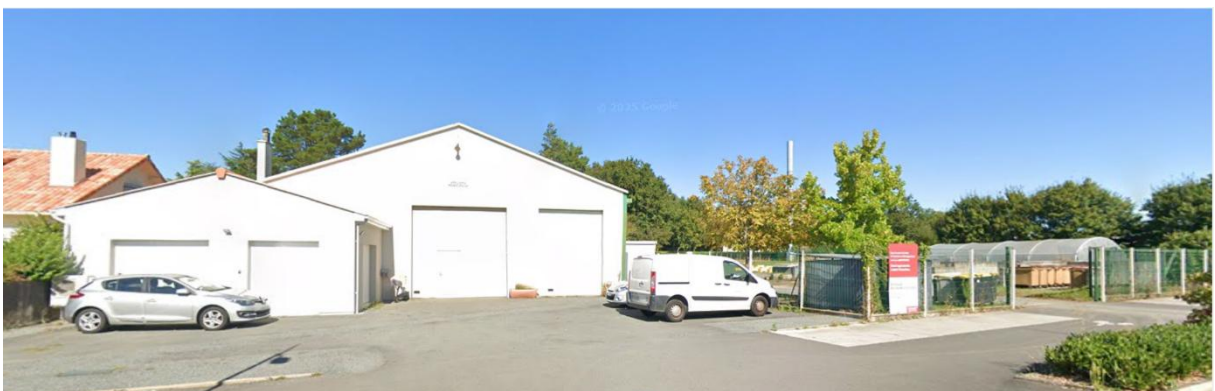
Ateliers Municipaux – 2 rue du Général de Gaulle

Choix des graines effectué lors du TROC GRAINES de Chloro'Fil de Nuailly.